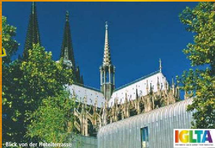
Blick von der Hotelterrasse

In diesem Hotel sind schwule und lesbische Gäste herzlich willkommen